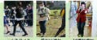
上小スマイルオリンピックス 手廻り練習 収穫祭取材

広報委員会 PTA広報誌「てのひら」やホームページ、各種お知らせに掲載するための取材活動を行っています。今年度は、上小スマイルオリンピックス、自治会、探検、つる切り、手廻り、収穫祭の取材を行いました。