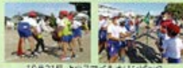
10月21日 上小スマイルオリンピックス

体育委員会 も身体が行うゲームの他に、プールもある程度まで行いました。また、上小スマイルオリンピックスの準備の準備を行いました。