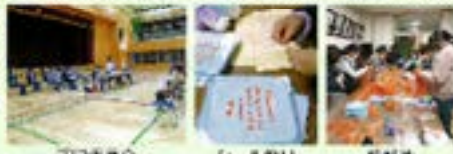
収穫祭準備 シル取り 終り

執行部 PTA総会や委員会、課外委員会を行い、学校と連携して行事が実施できるようにPTA活動の方針を決めたり、役割分担をしながら活動しています。収穫祭の時には、上三川小学校区民会館に収穫祭の準備を行いました。学校や子供の様子を身近に感じながら、楽しく活動しています。