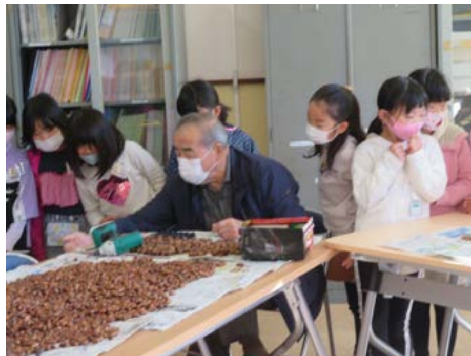
おもちゃ作り準備(1年)